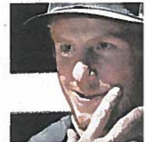
Ted Ligety a retrouvé le sourire à Sölden.

Toujours sur le podium depuis 2007, avec trois victoires entre 2011 et 2013, le coureur de Park City avait connu son unique cocac l'an dernier, lorsqu'une grosse faute en fin de seconde manche l'avait relégué au 10 e rang. Une anomalie pour celui qui est surnommé «Monsieur géant», mais qui est désormais corrigée. «Je m'entraîne ici depuis plusieurs années ( ndlr: Sölden ) et je connais bien le glacier. C'est un bon début. D'habitude, plus quand on sait qu'il s'agit de ma première course avec de nouveaux skis, s'est-elle réjouie. Je sais toutefois que je suis capable de mieux, de prendre encore davantage de risques.»